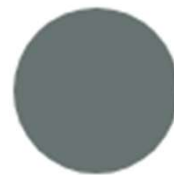
Šedá tmavá (695)