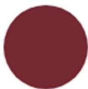
Červená tmavá (293)