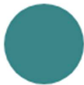
Modrá světlá (333)